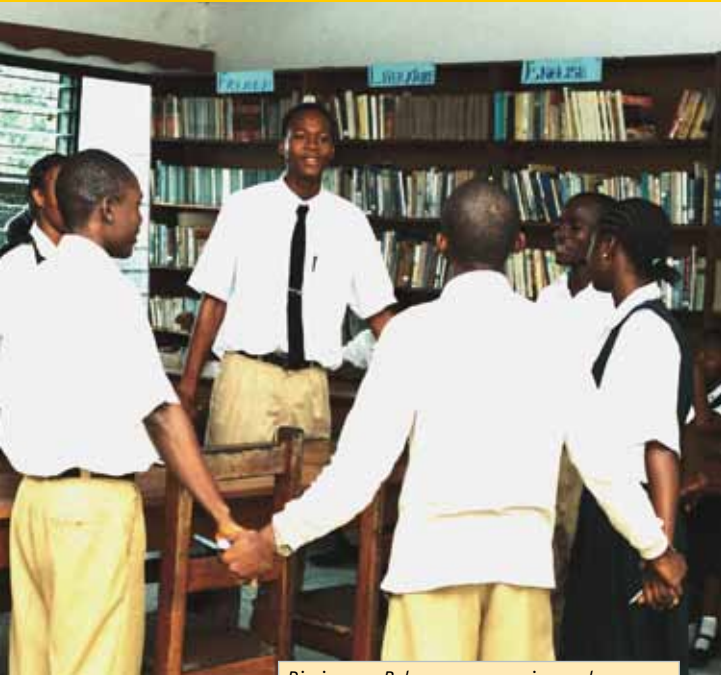
Die jungen Palavermanager singen den Streitschlichterapp.