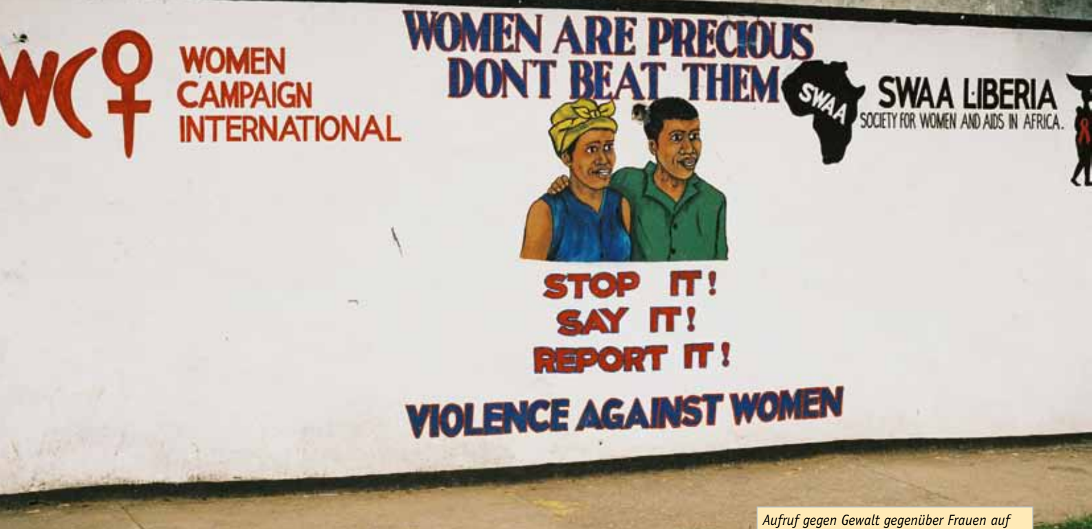
Aufruf gegen Gewalt gegenüber Frauen auf einer Hauswand in Monrovia.