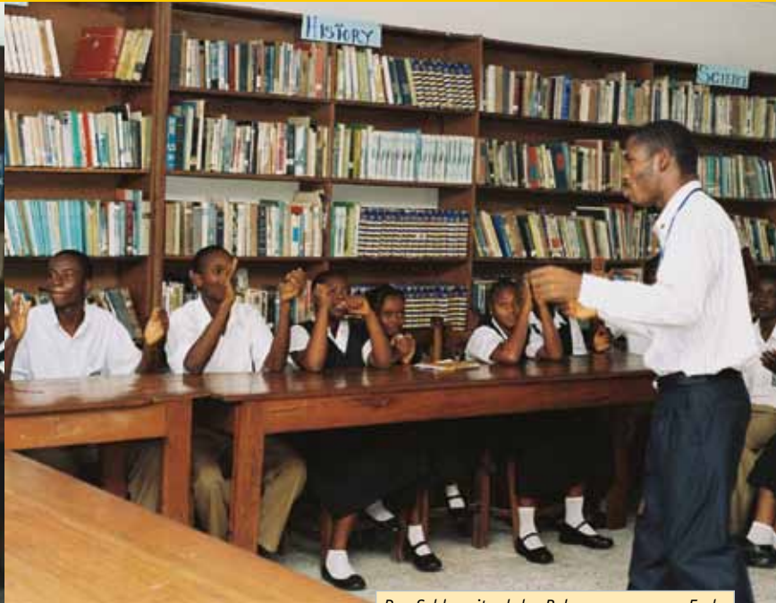
Das Schlussritual der Palvermanager am Ende der Mediation.