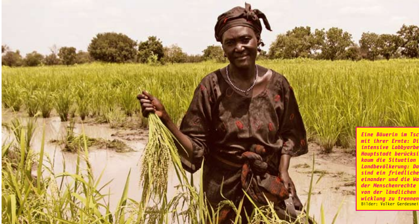
Eine Bäuerin im Tschad mit ihrer Ernte: Die intensive Lobbyarbeit der Hauptstadt berücksichtigt kaum die Situation der Landbevölkerung: Dabei sind ein friedliches Miteinander und die Wahrung der Menschenrechte nicht von der ländlichen Entwicklung zu trennen.