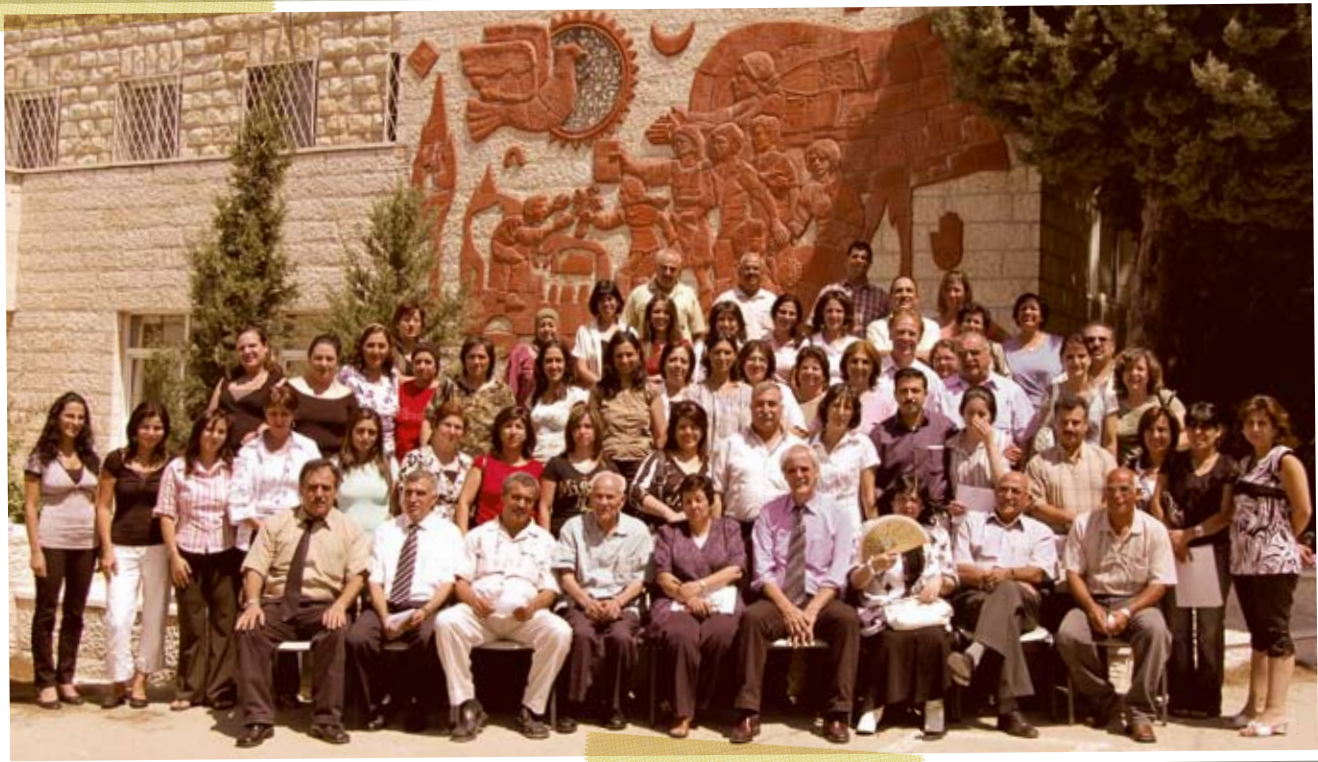
Das Lehrerkollegium an der Talitha Kumi Schule.